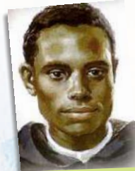
San Martín de Porres

Uno de los aspectos que el que resaltó este santo fue el de su cercanía con todas las criaturas de la naturaleza. A todas las llamaba “hermano (a)”, haciendo notar su importancia como parte de la obra de Dios y que nos ayudan a conocerlo a Él.