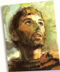
San Francisco de Asís

Lee: Los santos nos ayudan a cuidar la creación