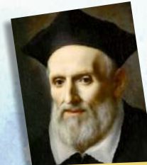
San Felipe Neri

Uno de los aspectos que se suele destacar de la vida de San Martín es el milagro que consistió en que reunió a perro, gato y ratón y los hizo comer en el mismo plato en absoluta calma y tranquilidad. Además de esto, se sabe que trataba con mucho respeto a todas las criaturas, incluyendo a los insectos, por ser creación de Dios.