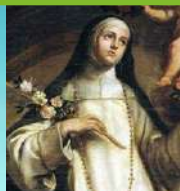
Santa Rosa de Lima